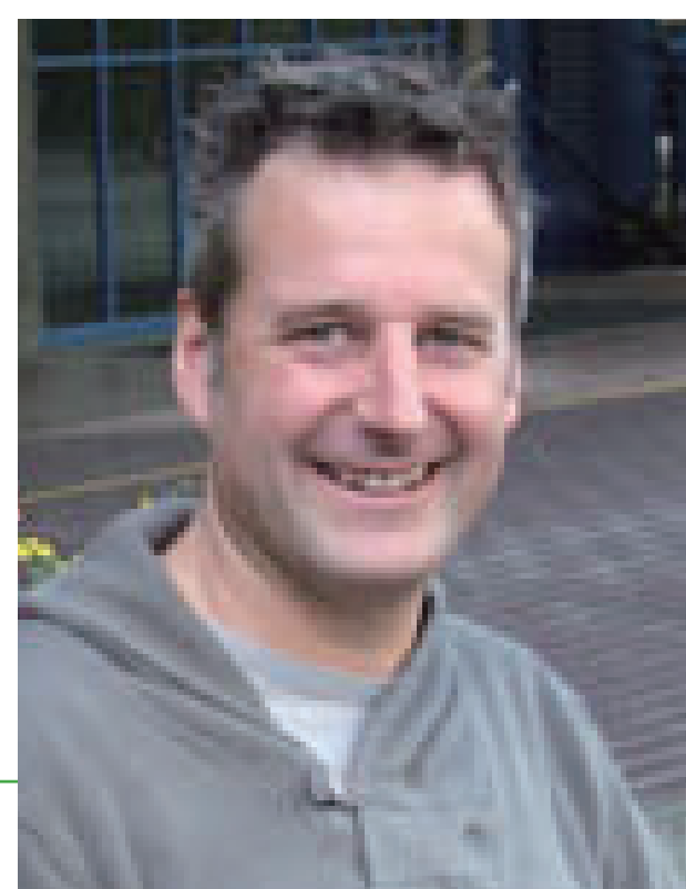
ショーン・グレゴリー