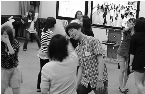
平成23年度 第2回ミュージックコミュニケーション講座の様子 (インターネット・ビデオ会議システムによる同時受講)