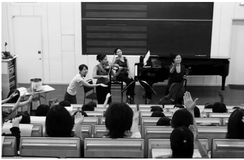
平成22年度 3大学合同夏期セミナーの様子 近隣の小学校4年生を交えて