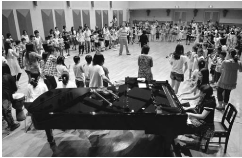
平成23年度 3大学合同夏期セミナーの様子 近隣の小学校4年生を交えて