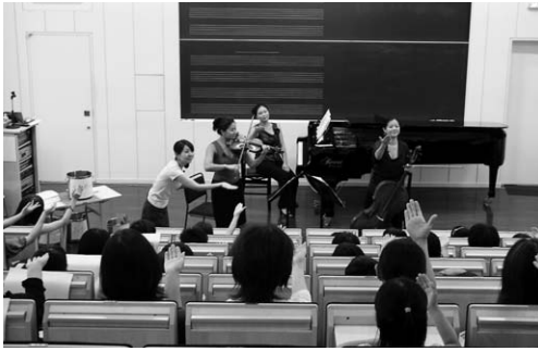
平成22年度 3大学合同夏期セミナーの様子 近隣の小学校4年生を交えて