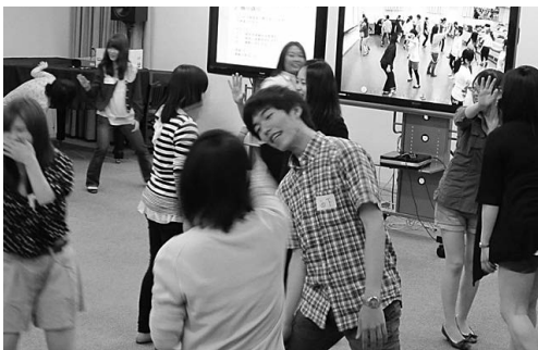
平成23年度 第2回ミュージックコミュニケーション講座の様子 (インターネット・ビデオ会議システムによる同時受講)